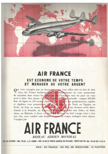
Publicités Air France dans la presse Indochinoise de l'époque